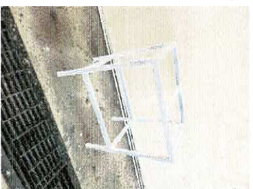
BIL 2: Fig 2 (a) the measure is for inner dimension . Fig 2 (b) Sample